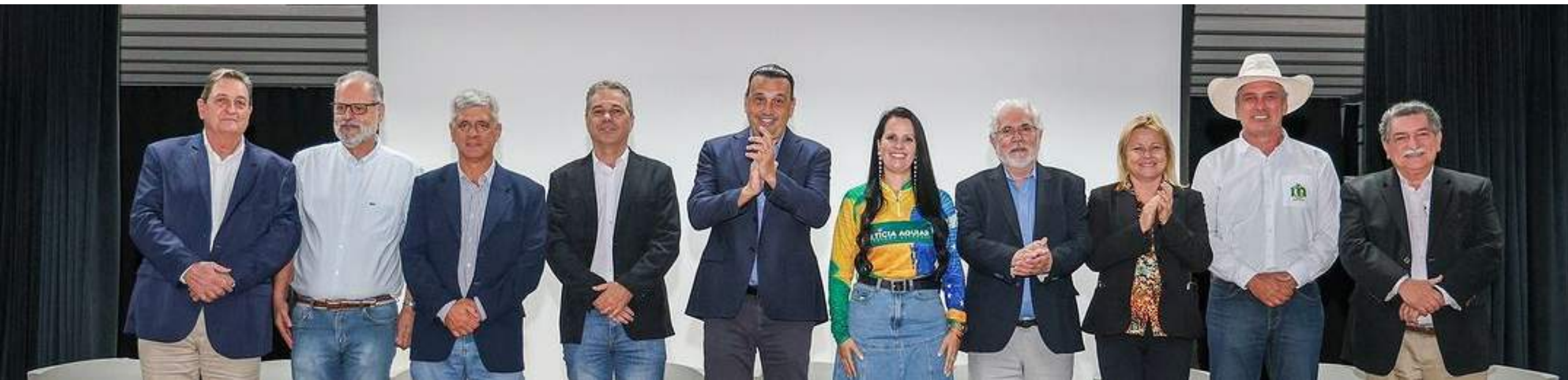
Foto histórica marca a abertura da feira AGROTECH EXPO 2024